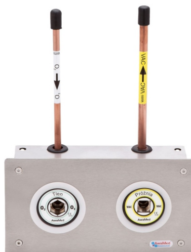
Tablica poboru DIN dla 2 gazów