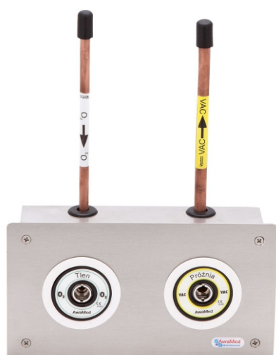
Tablica poboru AGA dla 2 gazów