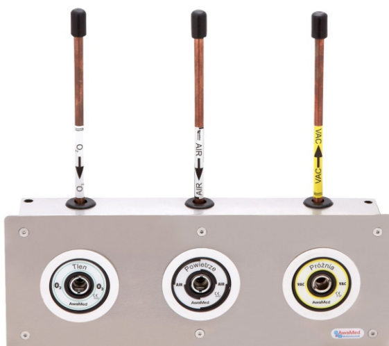
Tablica poboru AGA dla 3 gazów