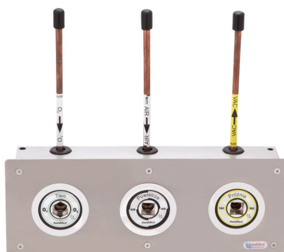
Tablica poboru DIN dla 3 gazów